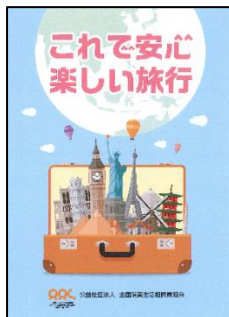
全相協ハンドブック 1 「これで安心 楽しい旅行」

(公社)全国消費生活相談員協会では、この度新たに全相協ハンドブックとして、下記5冊を発行いたしました。生活に役立つ情報をA5サイズでコンパクトにまとめました。是非ご活用ください。