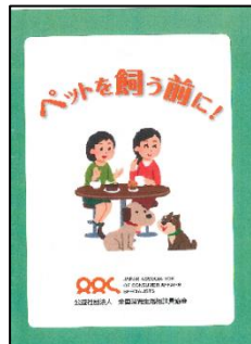
全相協ハンドブック 2 「ペットを飼う前に」